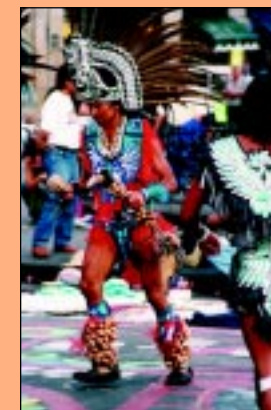
„Potomek Azteków” tańczący w centrum Meksyku, między Templo Mayor a Katedrą Metropolitalną

Zachwyca różnorodność wszystkiego: przedmiotów, ludzi, zwierząt... Można ją porównać do tego, w jaki sposób posługuje się tu kolorami. Są one bardzo wyraźne, jaskrawe i odważnie ze sobą zestawiane. I taki też jest Meksyk, kraj kulturowych i społecznych kontrastów. Między bogatymi dzielnicami stolicy, ich monumentalnymi, kolonialnymi zabytkami, a zapomnianą i zabiedzoną prowincją jest niemalże przepaść. Niestety ci najbiedniejsi to w większości Indianie. Wszystko jest tu przemieszane: tradycja i nowoczesność, Indianie i biali. Jest to przykład procesów akulturacyjnych, które zostały wywołane zderzeniem się, a następnie długotrwałym współżyciem dwóch obcych grup etnicznych: autochtonicznej — indiańskiej i europejskiej — iberyjskiej. W ciągu stuleci różne elementy pochodzenia europejskiego czy indiańskiego krzyżowały się ze sobą, co z kolei zaowocowało powstawaniem nowych mieszanych form i treści kulturowych. Efekt tego procesu widoczny jest do dziś w wielu dziedzinach życia tubylczej ludności Meksyku. Jedne elementy uległy dużym przeobrażeniom, inne zaś (zarówno obce, jak i tubylcze) zachowały się w niezmienionej formie do naszych czasów, co pozwala na odczytanie ich właściwego pochodzenia. Nie jest to jed-