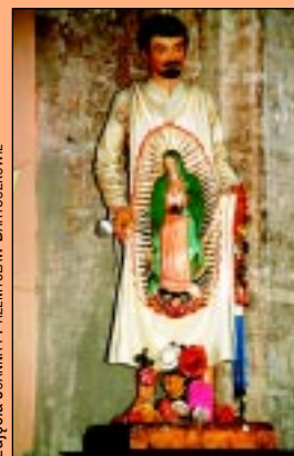
zdjęcia JOANNA I PRZEMYSŁAW BARTUSZKOWIE