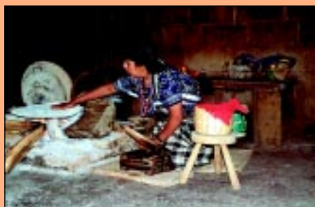
Wyrób tortillas metodą tradycyjną (Zinacantan)

Przykładów takiej dwoistości, jakie sprostaliśmy w podróży po Meksyku, można by z pewnością mnożyć. Na pewno warto jeszcze wspomnieć o tancerzach voladores . Tradycja tego tańca wywodzi się z ery prekolumbijskiej, od Totonaków zamieszkujących stan Veracruz, i wiązała się z kultem boga płodności i urodzaju Xipe Totec'a. Taniec odprawiano raz do roku, aby zapewnić urodzaj i płodność ziemi. Jego przebieg jest następujący: Pięciu mężczyzn w rytm bębna i piszczałki wspina się na 30-metrowy słup (pierwotnie drewniany), który symbolizuje pionową linię łączącą niebo, ziemię i świat podziemny. Na jego szczycie znajduje się platforma, z której czterech tancerze „zlatują” ku ziemi, zawieszeni na linach. Liny owinięte wokół słupa w czasie „lotu” stopniowo odkrywają się, co jeszcze dodatkowo wspomaga obracającą się platforma. Piąty tancerz stoi na platformie i gra na piszczałce, obracając się w cztery strony świata. Tancerze na linach wykonują 13 obrotów, aż dotrą do ziemi. W sumie daje to 52 obroty (13x4), co symbolizuje 52-letni cykl kalendarza mezoamerykańskiego. Dawniej, jak już wspominałam, taniec ten występował tylko na jednym terenie, obecnie grupy takich tancerzy można zobaczyć w wielu miejscach Meksyku. My spotkaliśmy ich w mieście Meksyk przed Muzeum Antropologii, w Teotihuacan — przed wejściem na teren piramid oraz w Tulum, na Yukatanie, w niewielkiej odległości od wejścia