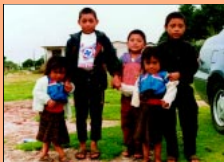
Dzieci z plemienia Tzotzil pozujące do zdjęcia za drobną opłatą (San Juan Chamula)