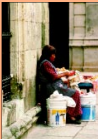
Kobieta wyszywająca bluzkę i sprzedająca słodycze i papierosy na ulicy w Oaxaca